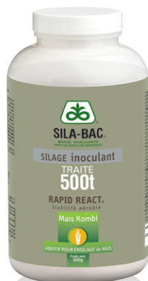
Flacon de 500 g* (500 tonnes brutes traitées)

À DÉCOUVRIR EN VIDÉO : le mode d'action et les bénéfices de la technologie Rapid React