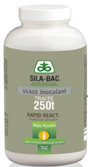
Flacon de 250 g (250 tonnes brutes traitées)