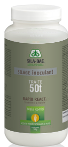
Flacon de 50 g (50 tonnes brutes traitées)