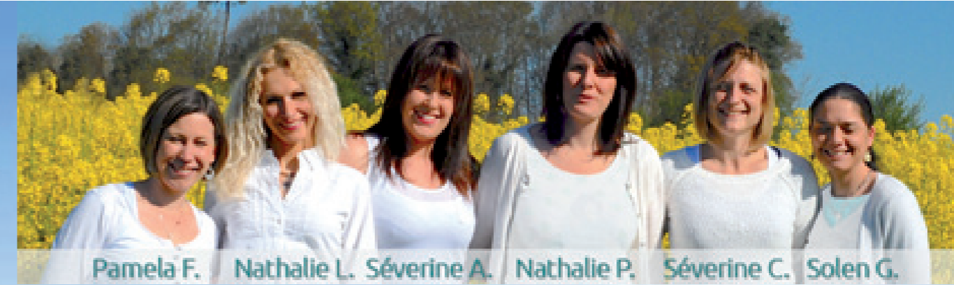
Pamela F. Nathalie L. Séverine A. Nathalie P. Séverine C. Solen G.

Appât granulé prêt à l'emploi Efficace par son appétence Action choc contre les limaces Excellente résistance à la pluie Contient un amérisant Très bonne répartition Grande largeur d'épandage Utilisation 3 à 7 kg / ha (AMM 2030430)